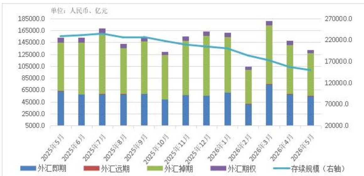
图5 近一年各外汇产品中央对手清算月度规模和月末存续规模

2026年5月，中央对手清算外汇交易26.4万笔，规模（折人民币）13.27万亿元，同比下降13.3%。从产品类型看，外汇即期5.49万亿元，外汇远期539.66亿元，外汇掉期7.18万亿元，外汇期权5503.6亿元。