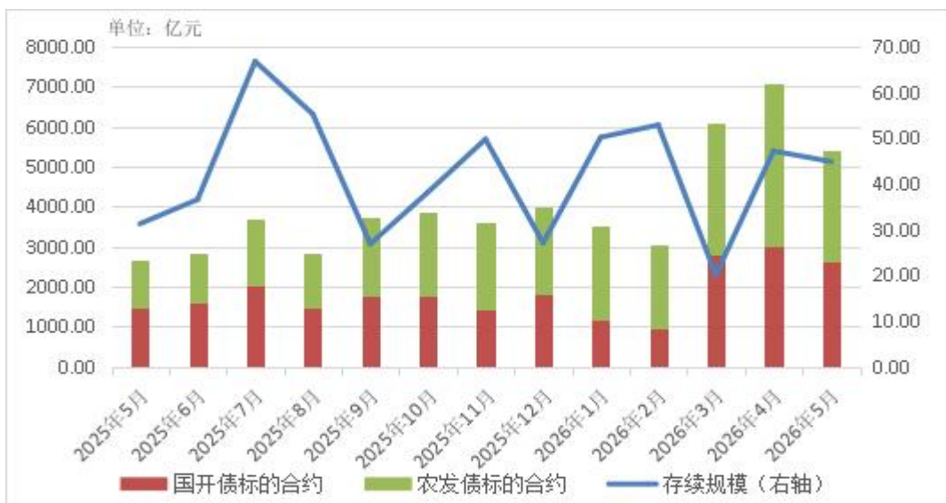
图4 近一年标准债券远期集中清算月度规模和月末存续规模

截至5月末，标准债券远期集中清算业务共有综合清算会员9家、普通清算会员42家、代理客户53家。当月通过综合清算会员代理清算210笔，规模1021.3亿元，代理清算占比9.5%。