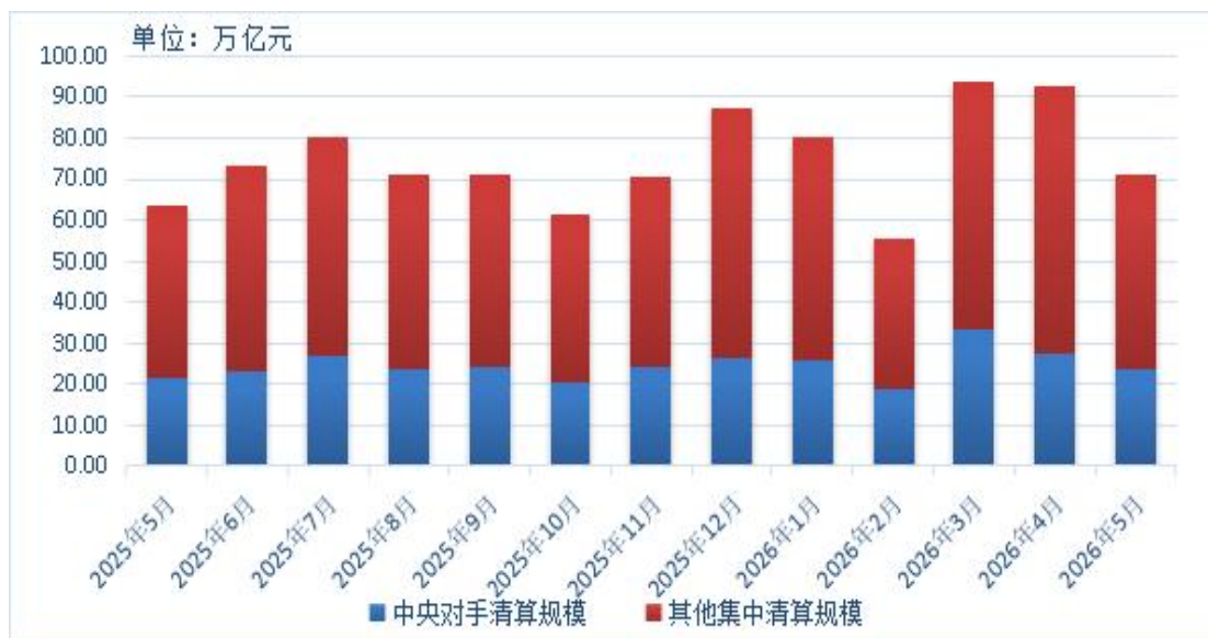
图1 近一年集中清算业务规模月度情况

2026年5月，上海清算所集中清算业务规模为71.31万亿元，同比增长12.6%。其中，中央对手清算23.33万亿元，同比增长8.9%；其他集中清算47.98万亿元，同比增长14.5%。